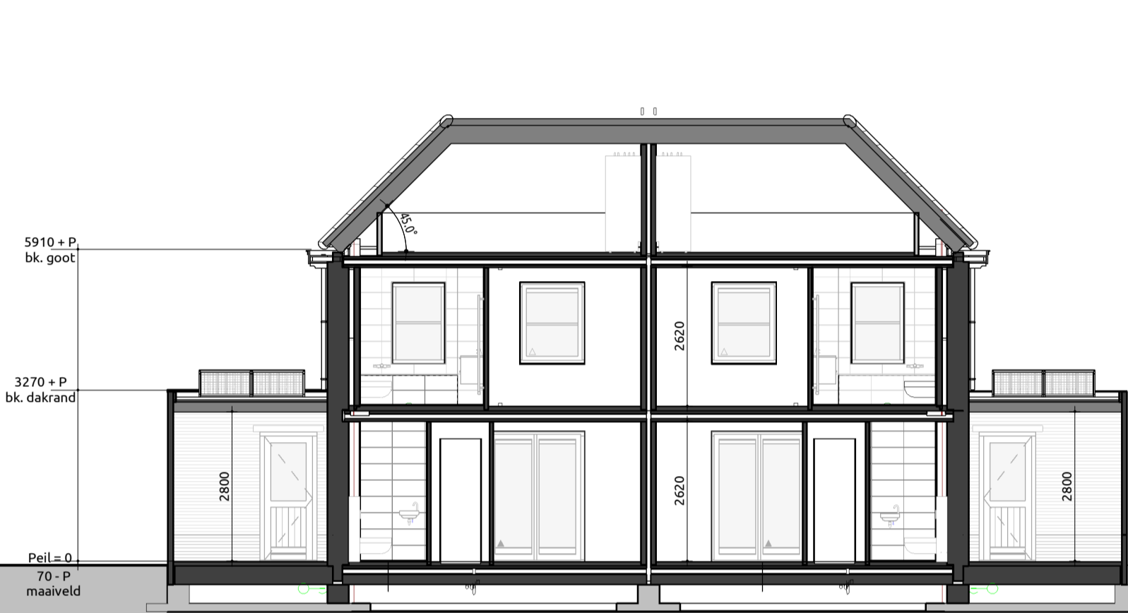
Doorsnede A-A 1:100