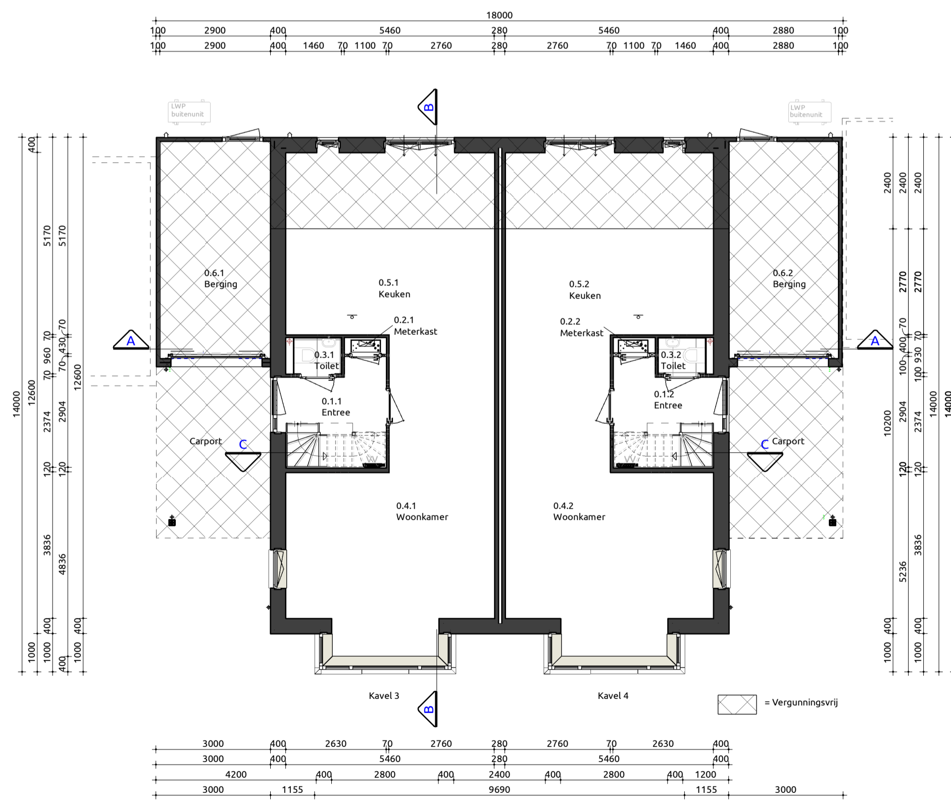
Begane grond 1:100