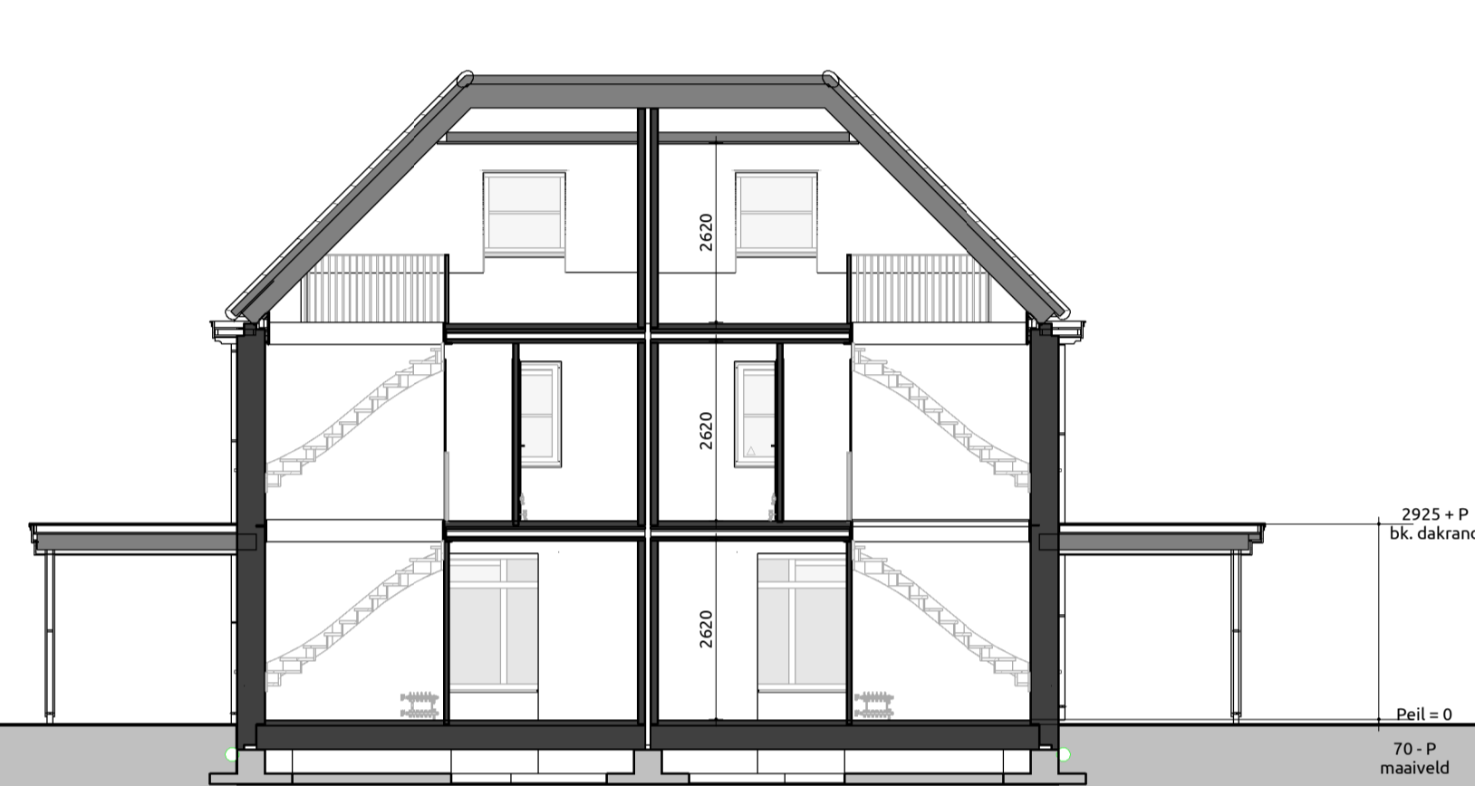
Doorsnede C-C 1:100