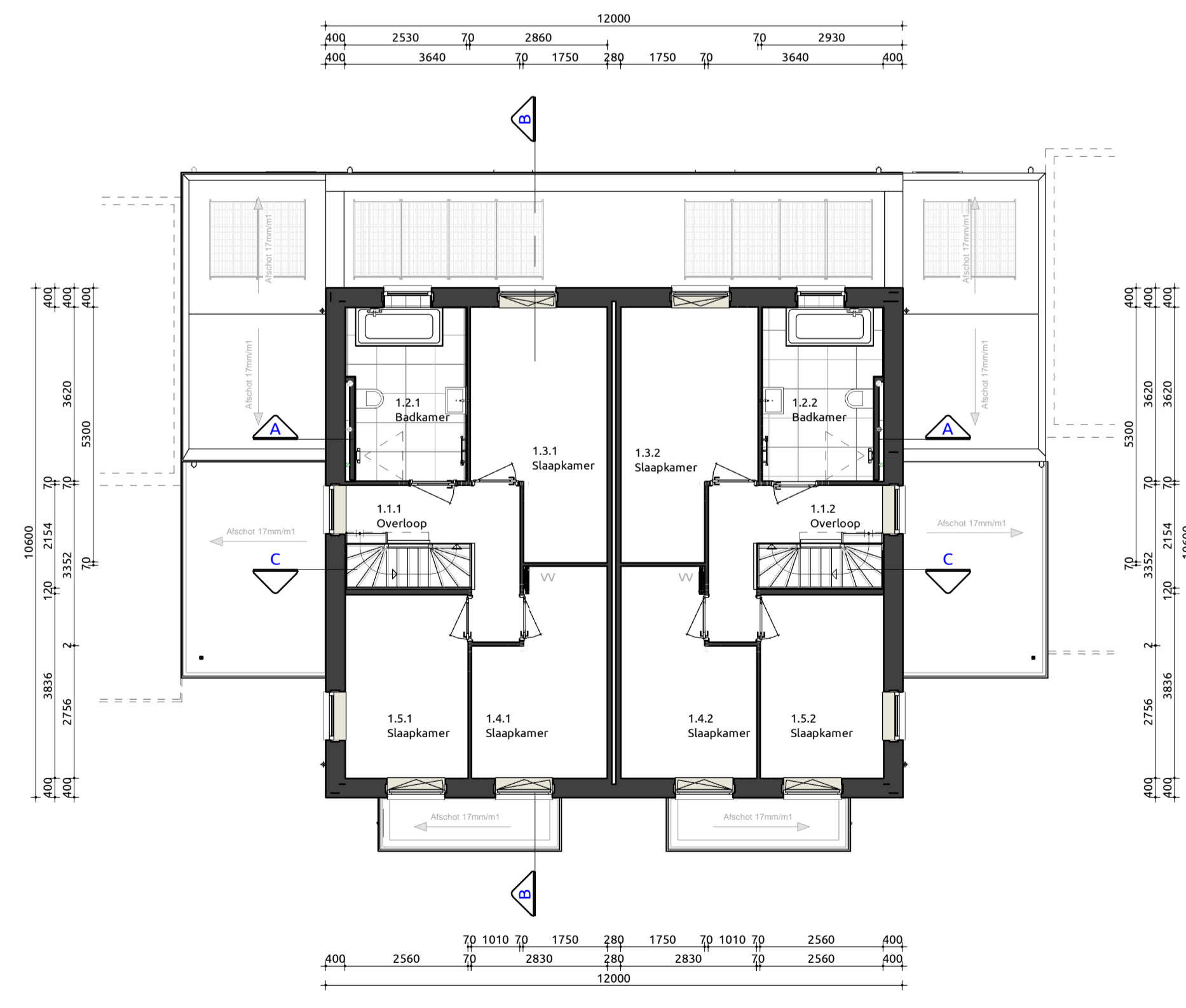
Eerste verdieping 1:100