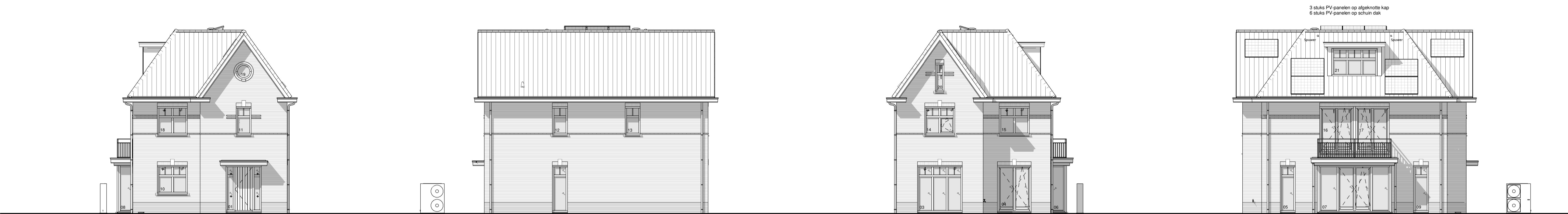
Voorgevel 1:100, Rechtergevel 1:100, Achtergevel 1:100, Linkergevel 1:100